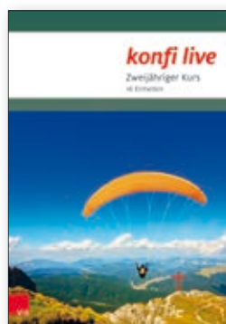
konfi live Zweijähriger Kurs 16 Einheiten Mit digitalem Zusatzmaterial ISBN 978-3-525-61507-2