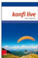
konfi live Mein Begleiter ISBN 978-3-525-61506-5