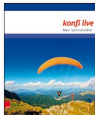
konfi live Mein Sammelordner ISBN 978-3-525-61509-6