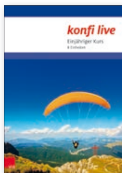
konfi live Einjähriger Kurs 8 Einheiten Mit digitalem Zusatzmaterial ISBN 978-3-525-61508-9